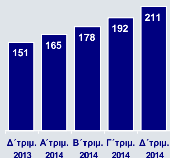
Οργανικά Κέρδη προ Προβλέψεων (€εκ.)

Η βελτίωση των λειτουργικών επιδόσεων της Eurobank που επιτεύχθηκε στα τρία πρώτα τρίμηνα του 2014 αποτυπώθηκε και στα αποτελέσματα του Δ΄ τριμήνου, καθώς τα οργανικά κέρδη προ προβλέψεων αυξήθηκαν κατά 9,8% σε €211εκ., από €192εκ. το Γ΄ τρίμηνο. Αύξηση καταγράφηκε τόσο στην Ελλάδα (11,9%) όσο και στις διεθνείς δραστηριότητες (5,3%). Πιο αναλυτικά: