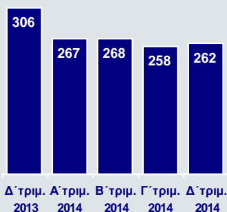
Λειτουργικά Έξοδα (€εκ.)