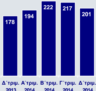
Κέρδη προ Προβλέψεων (€εκ.)