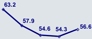
Κόστος προς Έσοδα (%)